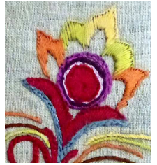
Broderie contemporaine du style de l'école de broderie bretonne de Pascal Jaouen