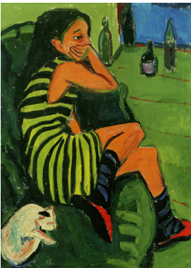
Ernst Ludwig KIRCHNER